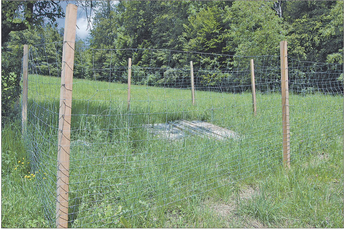
Eine weitere Doline ward geboren: Der momentan sechs Meter tiefe Schlund wurde mittels Zaun und Holzrost gesichert.