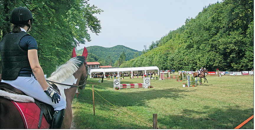
Zur Beruhigung vor dem Start noch ein letzter Zug, dann gehts los!