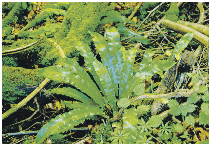
Hirschungsfarn: Im kühlen und ausgeglichenen Mikroklima der ehemaligen Gipsgrube gedeihen urtümliche und seltene Farne. Rechts: Üppige Wunderwelt in Grün – in den rund 120 Jahren seit Aufgabe des Gipsabbaus hat sich in der Grube eine einzigartige Vegetation entwickelt.