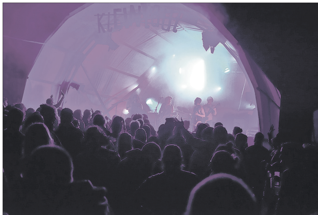
Oben links die erfolgreiche Schweizer Band «The Pedestrians». Unten und rechts zwei Stimmungsbilder vom Kleinlaut 2015.