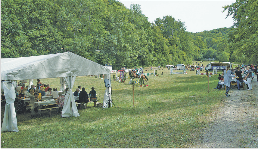
Blick über den Springplatz. Unten rechts: eine Teilnehmerin bewältigt den Sprung.

Der Reit- und Fahrverein Laubberg lädt zum 40. Pferdesporttag im Gansinger Sparblig auf Sonntag, 24. Juli, ein. Mit vier Prüfungen und einem attraktiven Mittagsprogramm wird den Pferdefans am Jubiläumsanlass viel geboten. Der Concoursplatz Sparblig – hier wird normalerweise auf 300 m geschossen – ist vom Team bestens vorbereitet worden