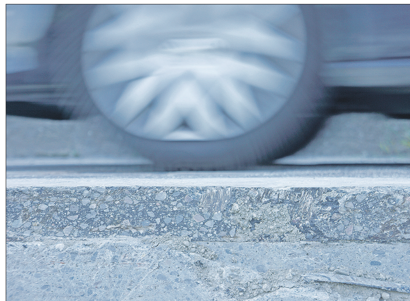
Die unterste Schicht ist die alte Betonstrasse, die obere die gegenwärtige Fahrbahn, die nun saniert wird.

Dem Schreibenden und mit ihm vielen älteren Automobilisten ist auf alle Fälle das charakteristische Rollgeräusch auf der Strecke Brugg-Schinznach noch in Erinnerung: Pädäng-Pädäng-Pädäng klang es. Dies, weil die Fugen der Betonplatten nie genau passten. Und die alte Betonstrasse, 50 Jahre befahren und 40 Jahre als tragendes Fundament dienend, wird ihre Funktion auch mit der neu aufgetragenen Fahrbahn behalten.