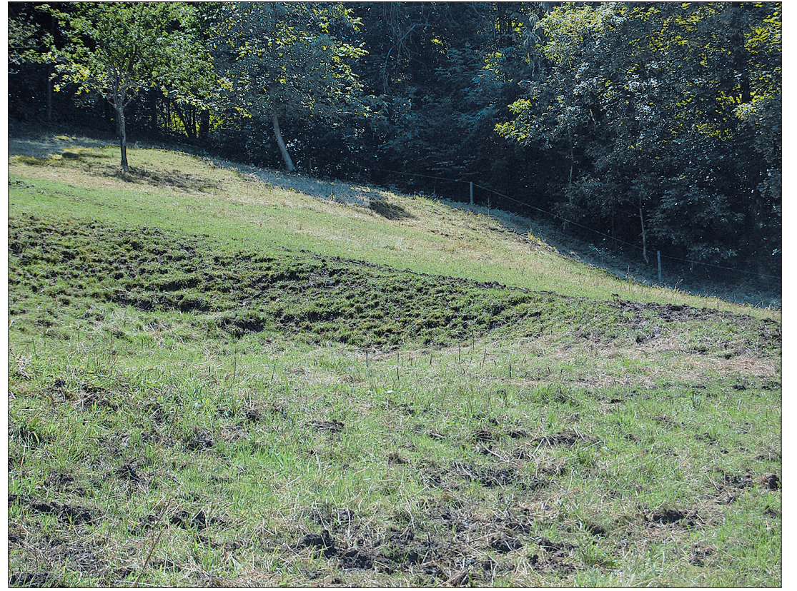
Ausgeprägte Dolinenlandschaft: In der Wiese nordöstlich von Schloss Habsburg sind durch Auswaschungen im Untergrund bereits mehrere Dolinen entstanden.