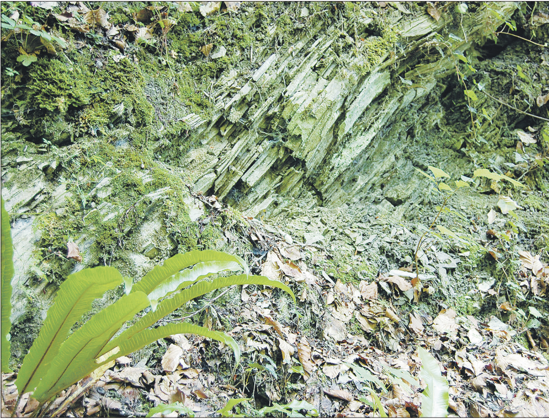
Millionen Jahre alter Rohstoff in der ehemaligen Gipsgrube Hölzlihalde: Erst durch die Kraft der Jurafaltung wurden die weisslichen Gipschichten steilgestellt.