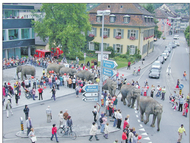
Vortritt Elefant hiess es 2002, als Knies Dickhäuter auf dem Lindenplatz bei der NAB gastierten.