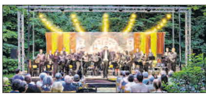
Die MG Schinznach-Dorf in Aktion.