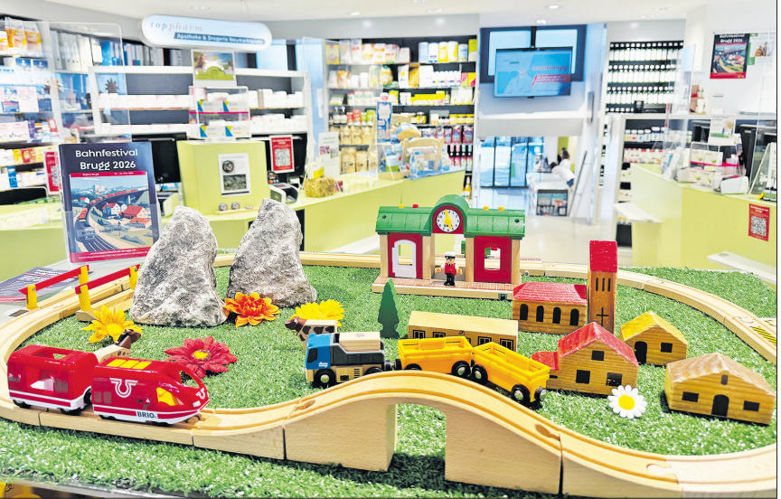
Das Bahnfestival zieht weite Kreise respektive Gleise: etwa bei den hiesigen Geschäften mit ihren tollen Schaufenster-Dekos.

Ein besonderes Highlight sind... ...nebst den diversen Festivalbeizen und Restaurants auch die beiden zusätzlichen Festbeizen: Eine befindet sich beim Storchenturm am Eingang zur Brugger Altstadt, die andere in luftiger Höhe auf dem Dach des Centurion-Towers. Beide sind exklusiv wäh-