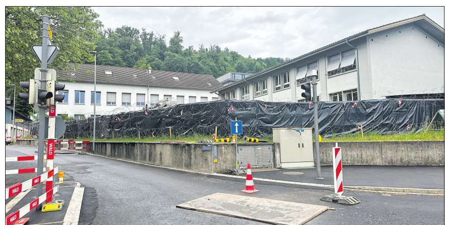
Mit der Kaserne zeigt sich auch der «bruggereisenfisch» verhüllt (Brugg verfügt als eine der wenigen Städte über drei Luginbühl-Plastiken, wobei alle ein bisschen versteckt sind – so wie die «Brugger Säule» beim Knoten Neumarkt und die Luginbühl-Bar im «Magma» im Bad Schinznach).