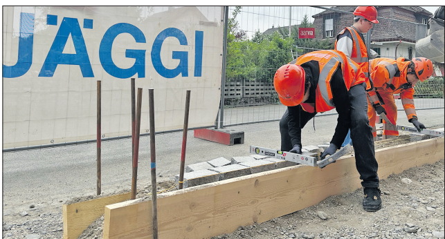
Die Aarvia vermittelte das kleine Einmaleins des Strassenbaus – und auch der Posten der Hausener Elektrofirma L+W AG stiess auf grosses Interesse (Bild unten).

Ein solches war vor allem auch vonnöten, weil die Bauarbeiten normal weiterliefen. Gut zu «Baustelle live» passte sodann, dass jene Firmen für die spannenden Einblicke sorgten, die wirklich vor Ort wirken: etwa der Brugger Baumeister Jäggi, der Hausener Elektrotrieb L+W AG oder die Aarvia.