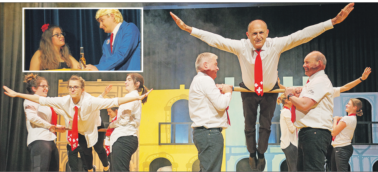
Ihr Reigen zeigt: Sie sind gewandt, die Schweizer Diplomaten. Kleines Bild: Trump landet nicht nur in Bözberg, sondern auch bei Miranda (Yoana Suarez) – und pflegt einen «interkulturellen Austausch» der besonderen Art.