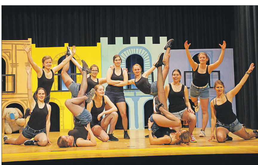
An den Bözberger Gogo-Girls hätte «The Donald» seine helle Freude.