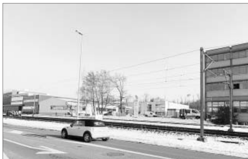
Das vorläufig dreigeschossige (plus ein Untergeschoss) Gebäude kommt neben den «Hectronic»-Bau zu stehen und wird über den Hunziker-Bahnübergang erschlossen.

Der Neubau – im Wildischachen wird es langsam eng – wird auf einem Grundstück der Brugger Liegenschaften erstellt. W. Thommen AG, Architekten und Planer, Olten, sind die Gestalter.