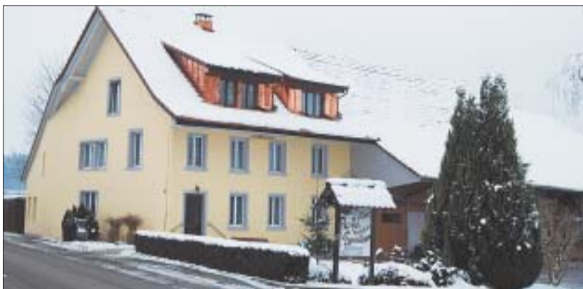
Nicht nur den 15'000 Bäumen, auch dem Loorhof selbst, der in frischem Glanz erstrahlt, kommt fachmännische Pflege zu.