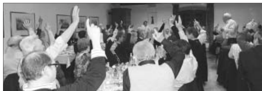
Wahlen bei der Gönnervereinigung des FC Brugg sind immer einstimmig!

JOST Elektroanlagen Telematik Automation