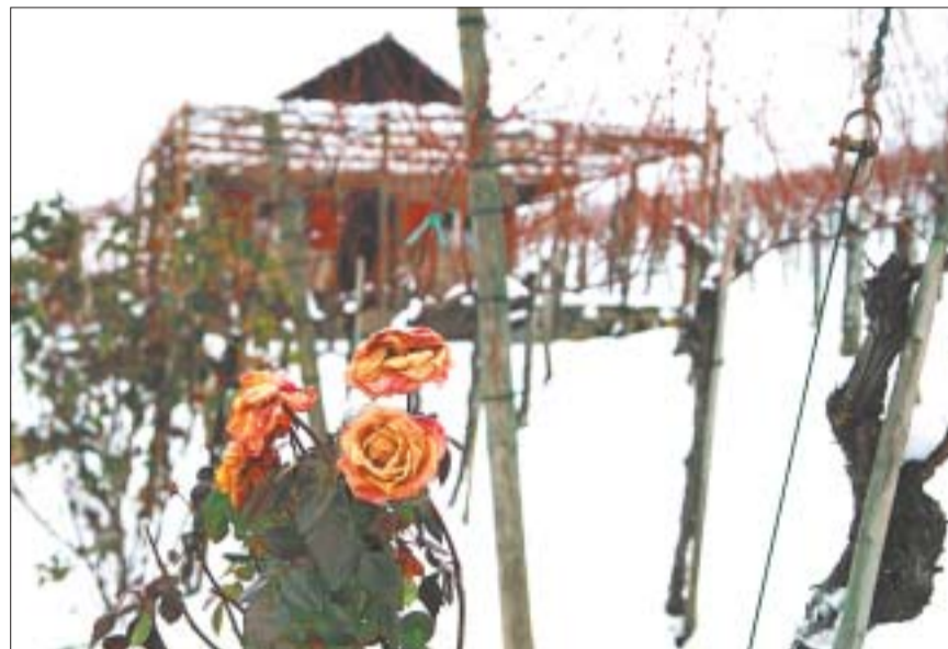
Birchmeiers Reben: für die Spaziergänger auch im Winter eine Zier.