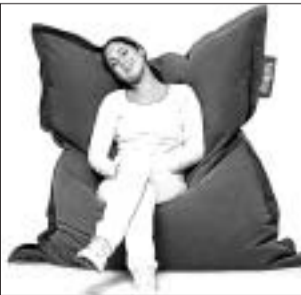
Ob Wärmekissen oder Sitzsack: Nur Fatboy das Original!