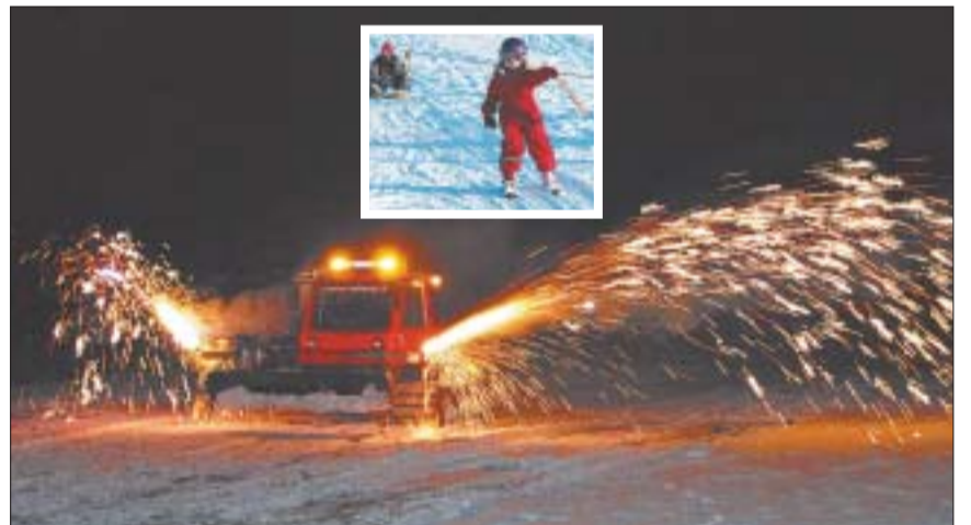
Feuerwerkend fuhr das Pistenfahrzeug aus der Dunkelheit zur Einweihung bei der «Bergstation» vom Rotberg-Skilift (kleines Bild: Am Samstag war «Pulver gut»).

bene gratis! – fleissig benutzt. Bei beleuchteter Piste sogar zum Nacht-Skifahren und –Schlitteln. Vor einiger Zeit kündigte sich ein weiterer Knüller an: Die Firma Mobirep Moser in Turgi kam zu einem ausser Betrieb gesetzten Pistenfahrzeug Jahrgang 1981, das einst im Bündnerland im Einsatz stand. Moser schenkte diesen 3,5 Tonnen schweren Oldtimer spontan den sieben Villiger Skilift-Fans. Für diese war sofort klar: Den revidieren wir, der kommt auf dem Rotberg zum Einsatz. Unzählige Freizeitstunden waren sie an der Arbeit, um den Bully wieder einsatzfähig zu machen. Am letzten Samstag um 21 Uhr war es schliesslich so weit: Das Nacht-Skifahren wurde plötzlich unterbrochen. Beim temporären Rotberg-Beizli kam das von seinen jetzigen Besitzern auf den Namen «Pitbull» getaufte Pistenfahrzeug funkenprühend angerattert. Die vielen Dutzend kleinen und grossen Pistenbe-