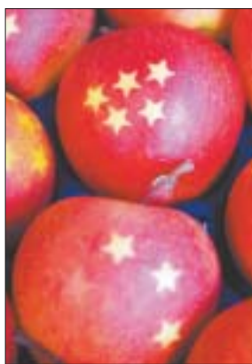
Blick in den attraktiven Hofladen mit knackigen Weihnachtsäpfeln & Co.