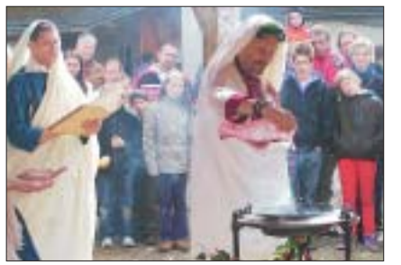
Einweihung Nr. 1: Die «Vicini Vindonissenses» trüfeln Wein ins Feuer.

Leber in ein Behältnis plumpsen. Ihr Aussehen liess, so wollen wir mal ähnlich frei wie ein Haruspex interpretieren, durchaus den Schluss zu, dass der Legionärspfad vor Unbill gefeit zu sein scheint.