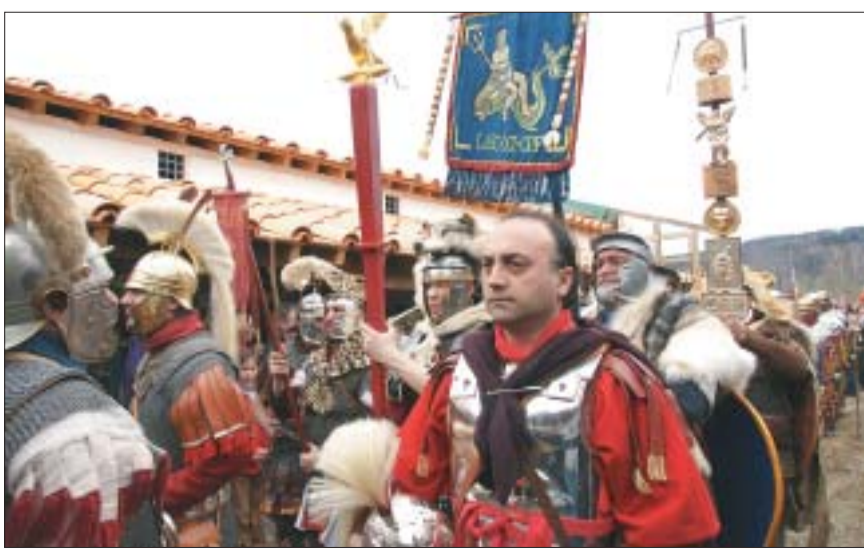
Die Legio XI bezog die Contubernia – da können auch Schulklassen römisch träumen. Mehr zu dieser einmaligen Art der Geschichtsvermittlung unter legionärspfad.ch.