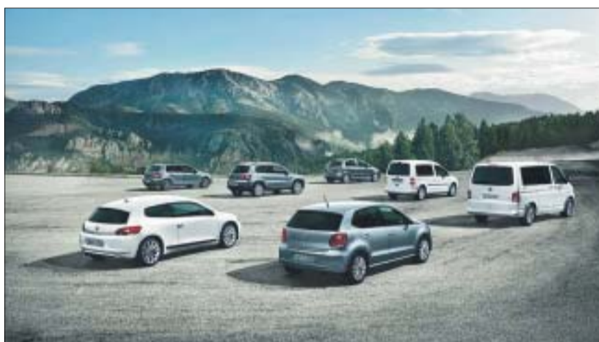
VW 2011: An der Ausstellung lässt sich die ganze Palette besichtigen und probefahren.

Die Frühlingsausstellung bei Volkswagen Amag Retail Schinznach Bad ist vom 29. April bis 8. Mai zu den jeweiligen Geschäftszeiten, an den Sonntagen 1. und 8. Mai von 13 bis 17 Uhr geöffnet.