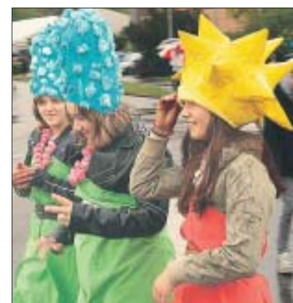
Auch schon am Umzug gesichtet: Marge und Lisa Simpson...

Scherz: Kinder im Mittelpunkt Die Scherzer bieten ihren Kindergarten-Kindern und den Erst- bis Drittklässlern nach dem Umzug zuhause je eine gediegene Morgenfeier. Um 11.05 Uhr nehmen alle Kinder am Umzug durchs Dorf teil, dann gibts die Examenbrote. Auf 14.30 Uhr ist die erste Vorführung von «De König wo d Ziit vergässe het» (Zweitaufführung um 19.30 Uhr). Der Nachmittag ist für Spiele reserviert, um 21 Uhr ist offiziell Schluss – und am Montag, 2. Mai schulfrei!