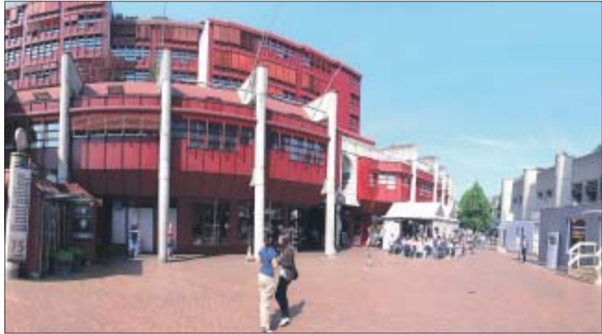
Bereits im Container untergebracht sind die Bank Coop und Bloesser Optic (rechts).