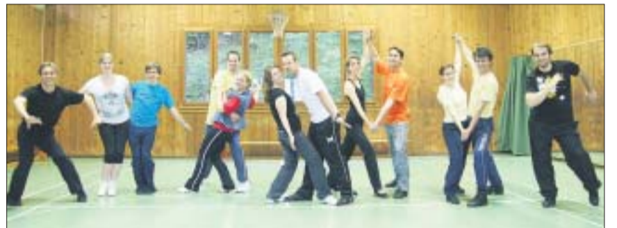
Der Hausener Rock'n'Roll Lollipop gives you a warm welcome (links) und hat fleissig trainiert (Bild oben), um an seiner Show nicht nur als Organisator zu brillieren.