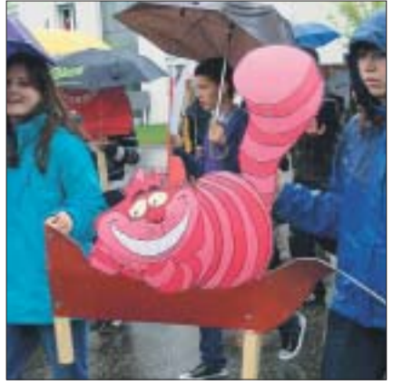
Letztes Jahr hagelte es Katzen – etwa die «Grinse-Katze» aus Alice im Wunderland...