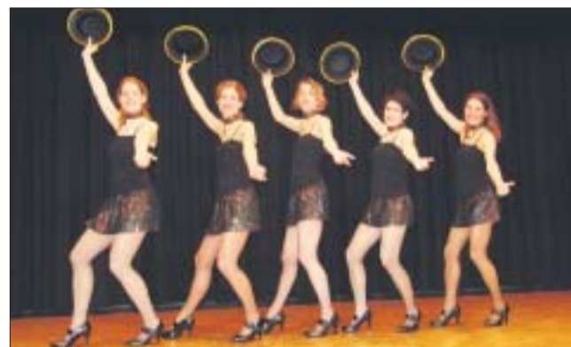
«Lollipop» bietet Eyecatcher sonder Zahl.

«Lollipop» bietet ausserdem auch Tanzkurse für Anfänger und Fortgeschrittene an. Zum Beispiel den Beginner-Kurs, der am 5. Mai startet und bis 30. Juni für nur 100 Franken pro Person acht Mal stattfindet (19.45 - 20.45 Uhr, Turnhalle Dorf, Hausen). Mehr Infos: www.rrollipop.ch