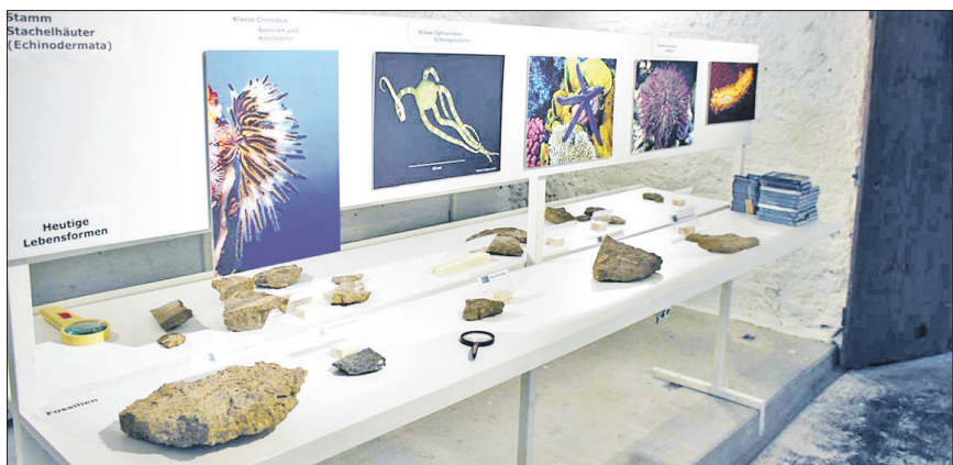
Die Fossilien sind einerseits in Vitrinen ausgestellt, andere können eigens studiert werden und mit den 'modernen Modellen' verglichen werden

Das Heimatmuseum von Schinznach-Dorf befindet sich an der Oberdorfstrasse 13 hinter dem Gemeindehaus (Postautohaltestelle, Gemeindehaus). Öffnungszeiten: jeden ersten Sonntag im Monat