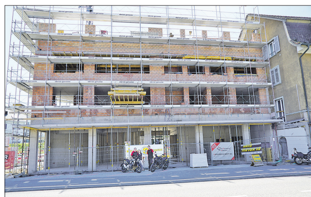
Links die Stirnseite des Urech'schen Gewerbebaus und rechts die Frontansicht mit dem Ausstellungs- und den Wohngeschossen – die Motorrad-Familie mit Honda und Yamaha vor dem späteren Ausstellungslokal.